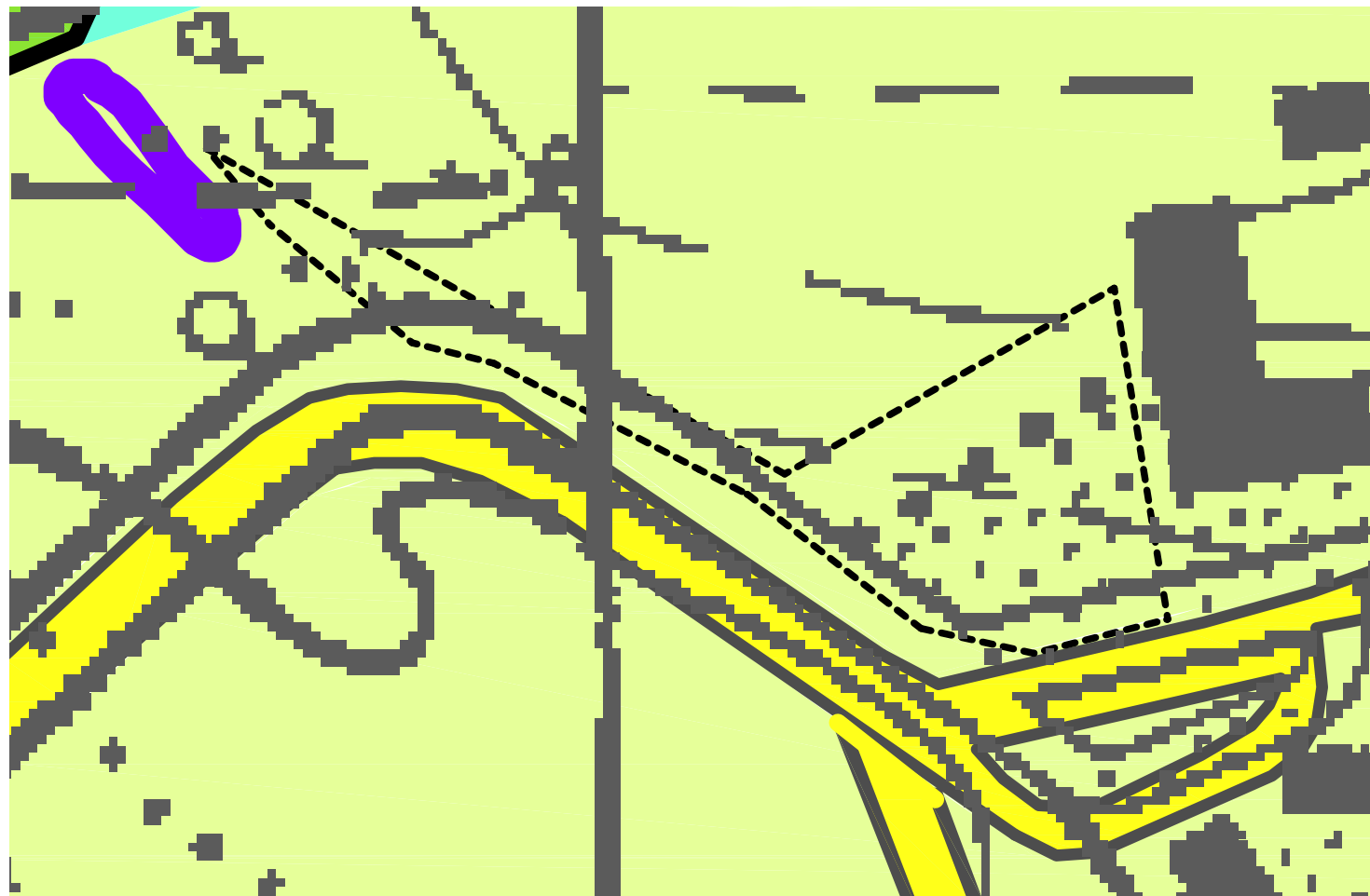
Flächennutzungsplan Bestand M 1:1.000