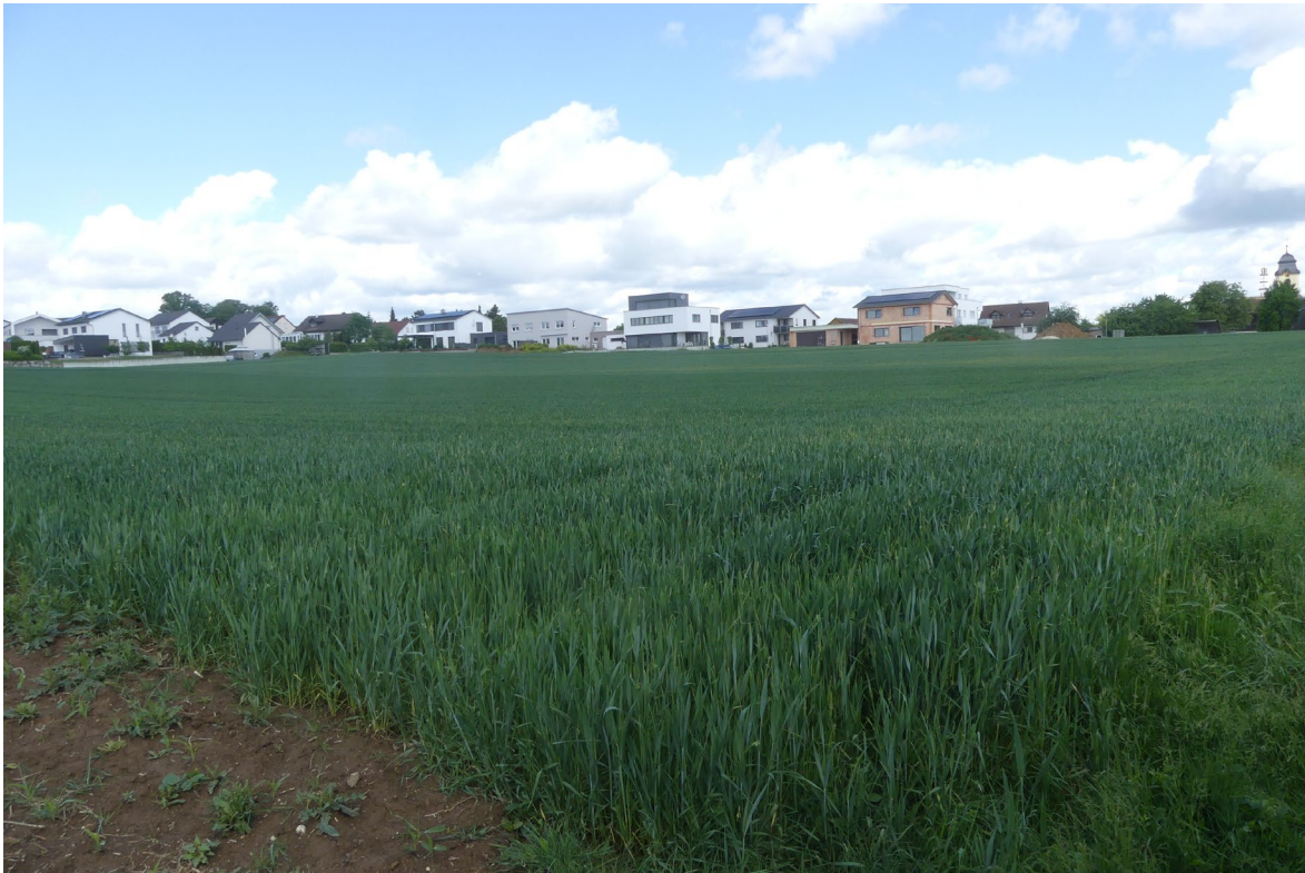
Abbildung 2: Blick auf den Acker (25.5.2022), der zum Wohngebiet entwickelt werden soll und im Hintergrund das bereits bestehende Wohngebiet.