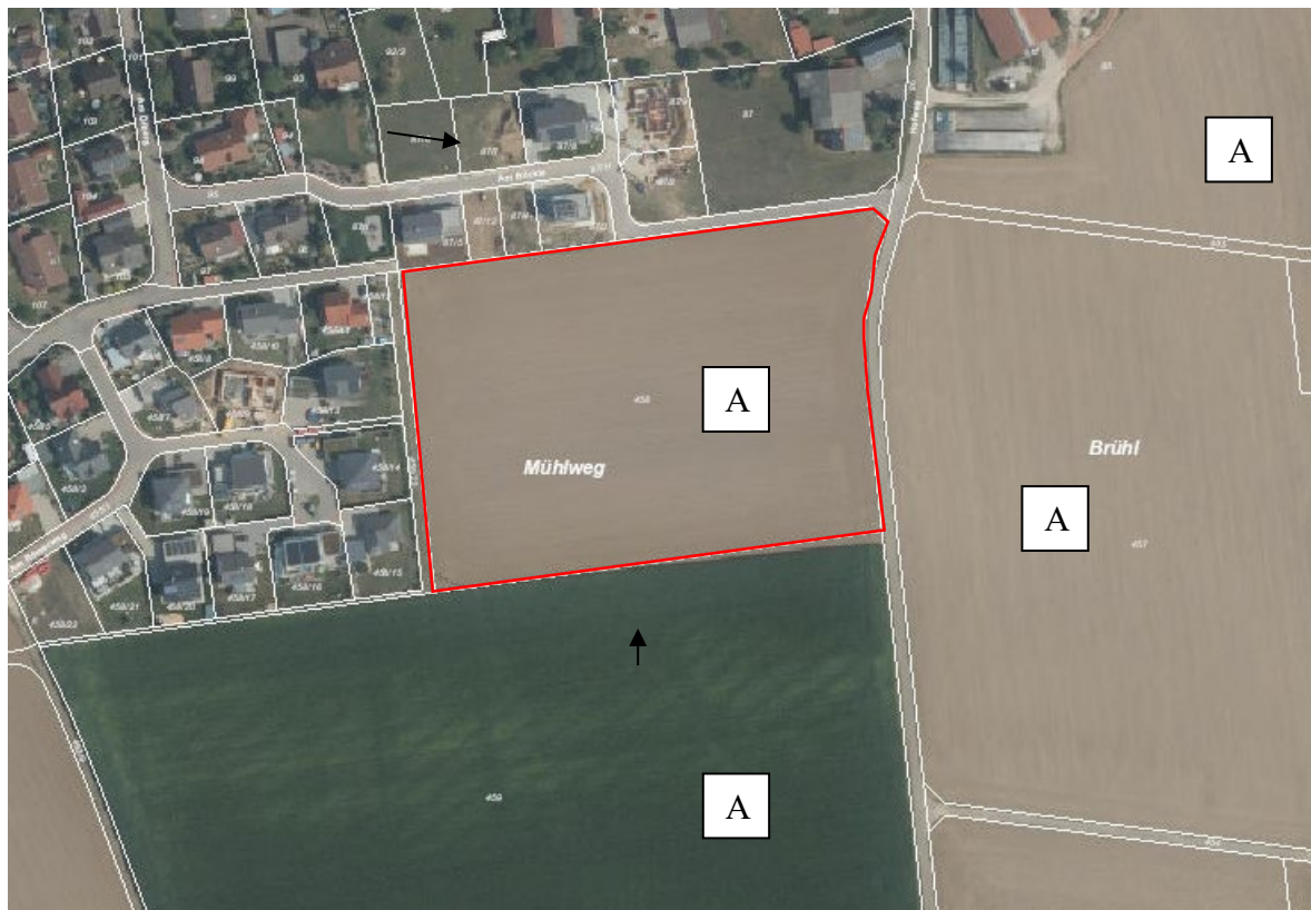
Abbildung 1: Nutzungen im rot umrahmten Untersuchungsgebiet und in seiner Umgebung A = Acker