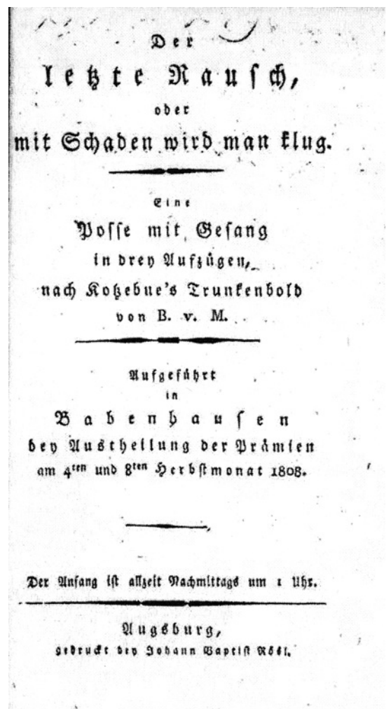
(Abb. 9) Textheft Babenhausen 1808