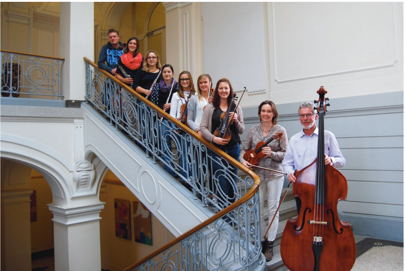
(Abb. 6) Das Orchester in Kammermusikbesetzung