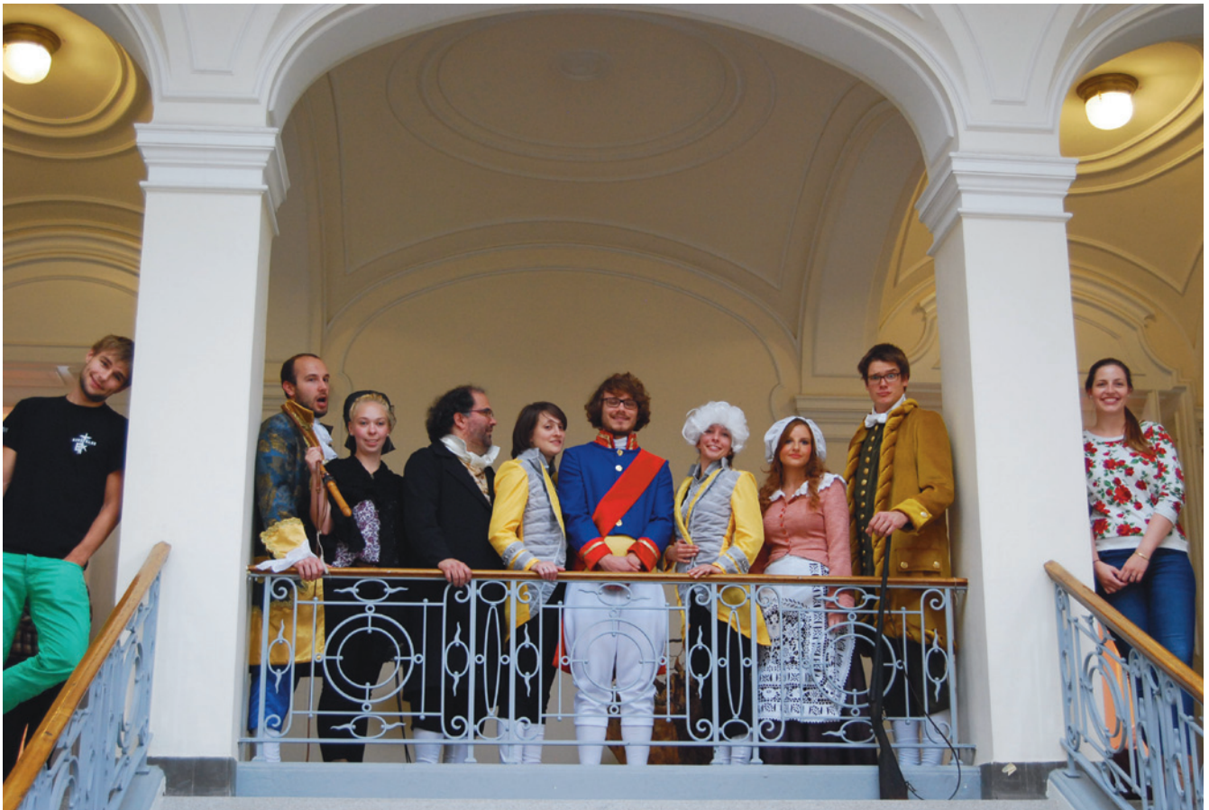
(Abb. 5) Ein Teil der Akteure