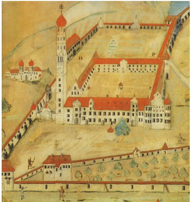
(Abb. 8) Klosteranlage Ursberg 1734