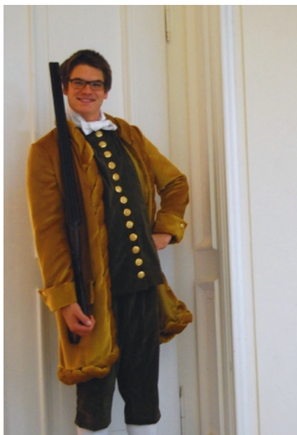
(Abb. 14) Jagdjunker Johann – Replikat nach einer Porzellanstatuette Meißen (um 1750) (Maja Negraschis)

Auch die Kostüme sollten möglichst authentisch sein. Da wir die Handlung im historischen Territorium der Rieser Adelshöfe mit den Linien Oettingen-Oettingen, Oettingen-Wallerstein, Oettingen-Spielberg und Oettingen-Baldern spielen lassen, stellten wir uns zuerst die Frage nach den Livree-Farben. Welcher Farb- und Textilwelt ist Bühler bei seinen Kontakten mit dem Rieser Hochadel begegnet? Die Fürstlichen Archive auf Schloss Harburg bergen aufschlussreiche Ergebnisse, die durch Exponate aus dem Kunsthistorischen Museum Wien ergänzt und durch die Tüchtigkeit unserer Schneiderin zu neuem Leben erweckt wurden.