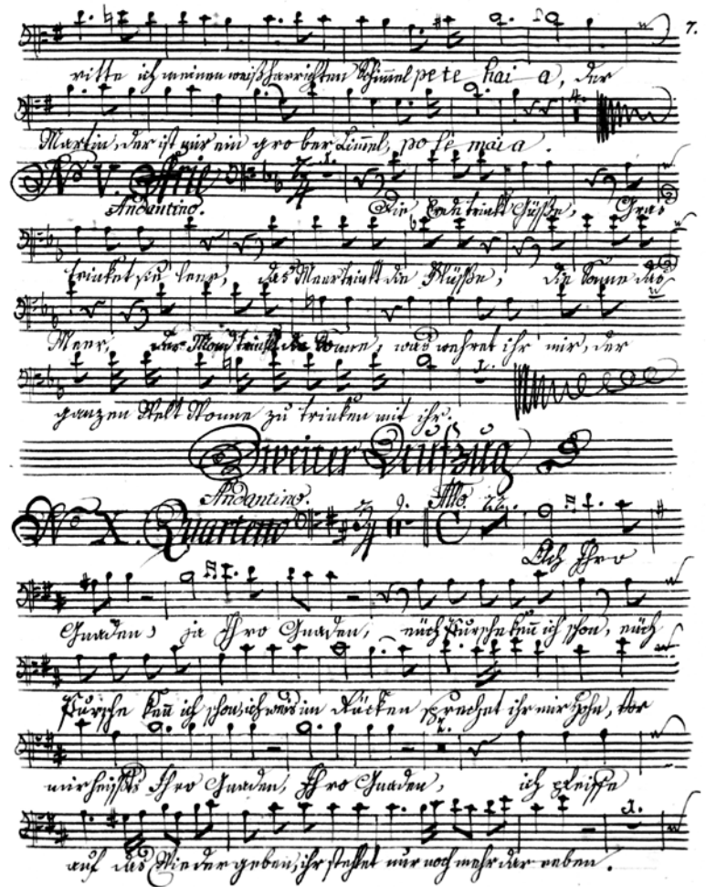
(Abb. 10) Stimme des Rochus (Bass)