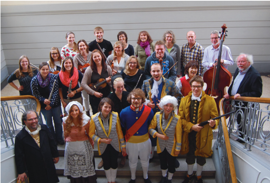
(Abb. 15) Ein Teil der Akteure und des Orchesters

Thema Bühler-Musik-Theater-Bühne mit Studierenden der PH Schwäbisch Gmünd.