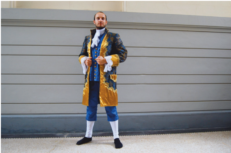
(Abb. 12) Das Kostüm unseres Pseudobaron Rochus – angelehnt an eine Kutscher-Livree (um 1870) des Fürstlichen Hauses Oettingen-Wallerstein (Maja Negraschis)