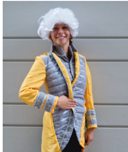
(Abb. 13) Livree eines Lakaien der Fürsten Oettingen-Wallerstein (um 1830) – Replikat nach einem Exponat im Kunsthistorischen Museum Wien (Maja Negraschis)