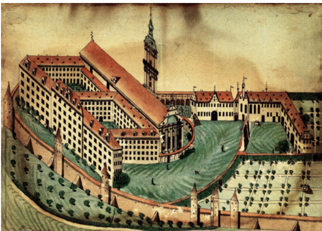
(Abb. 7) Klosteranlage Heilig Kreuz um 1780