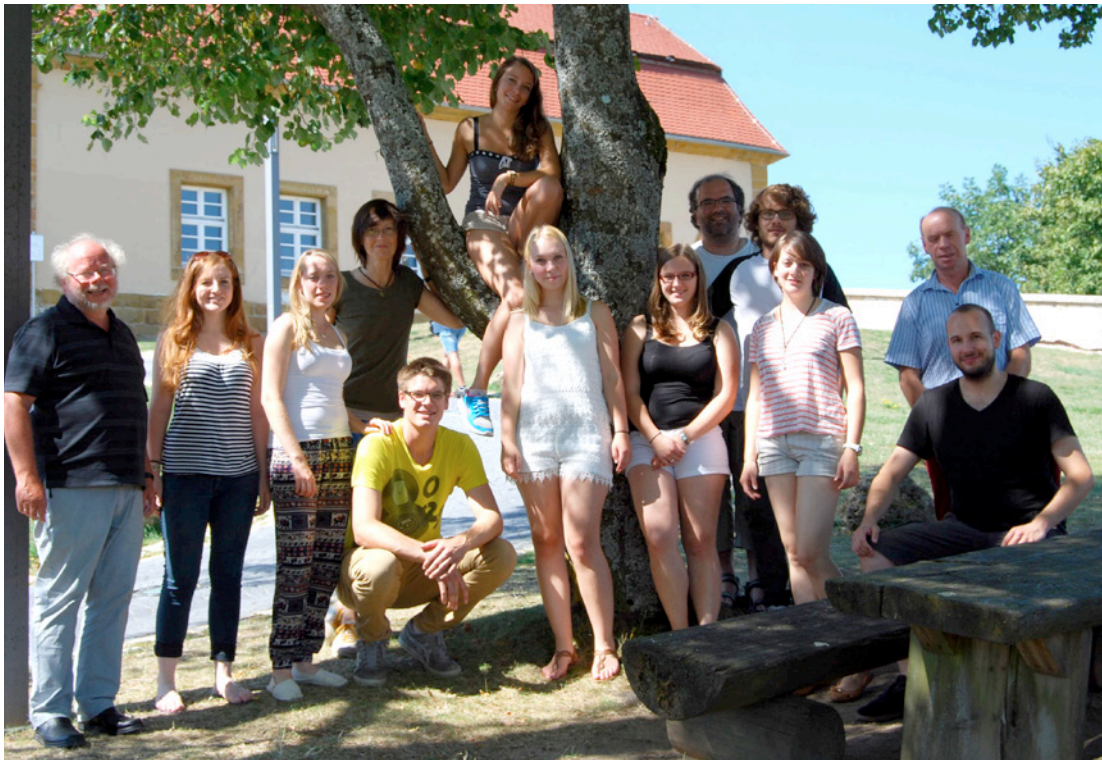
(Abb. 1) Probenpause auf Schloss Kapfenburg (Internationale Musikschulakademie)