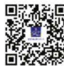
Sitzungskalender Kreistag des Ostalbkreises

Scannen Sie hierzu einfach den jeweiligen QR-Code.