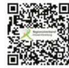
Sitzungskalender Regionalverband Ostwürttemberg