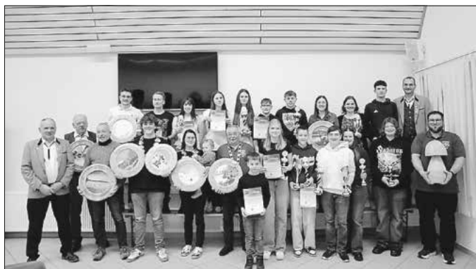
Das Bild zeigt alle Gewinnerinnen und Gewinner

Am Montag, den 5. Januar 2026, fand bei den Jagstquellschützen Walxheim die diesjährige Königsfeier statt. Im Rahmen der Veranstaltung wurden die neuen Schützenköniginnen und Schützenkönige gekürt. Die Königsfeier zählt zu den festen Höhepunkten im Vereinsjahr und erfreute sich auch diesmal großer Beteiligung. Neben dem Königsschießen wurden zahlreiche weitere Preise vergeben. Dazu gehörten mehrere gestiftete Schützenscheiben und andere gestiftete Preise von Vereinsmitgliedern.