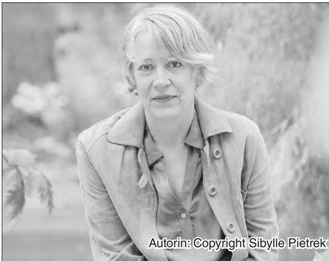
Autorin: Copyright Sibylle Pietrek

Nördlinger Ries, die Spannung, Empathie und eindrucksvolle Charaktere vereint.