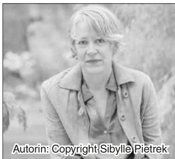
Autorin: Copyright Sibylle Piétrek

In der Pause und nach der Veranstaltung werden Kaltgetränke angeboten.