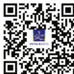
Sitzungskalender Kreistag des Ostalbkreises

Scannen Sie hierzu einfach den jeweiligen QR-Code.